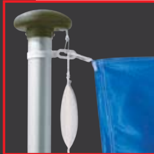
Mastkopf mit Gewicht